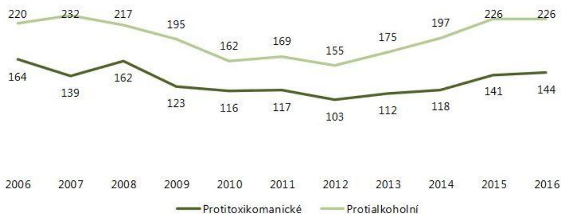
Graf 1: Počet uložených ochranných léčení v letech 2006 – 2016.